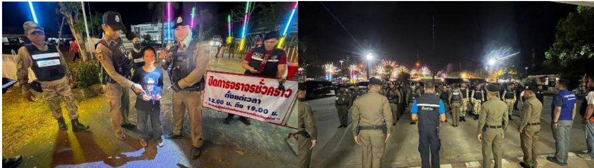
จัดกำลังเจ้าหน้าที่รักษาความสงบเรียบร้อย งานคอนเสิร์ต ในพื้นที่อำเภอบ้านกรวด ระหว่างวันที่ ๒๗ - ๒๙ กุมภาพันธ์ ๒๕๖๗