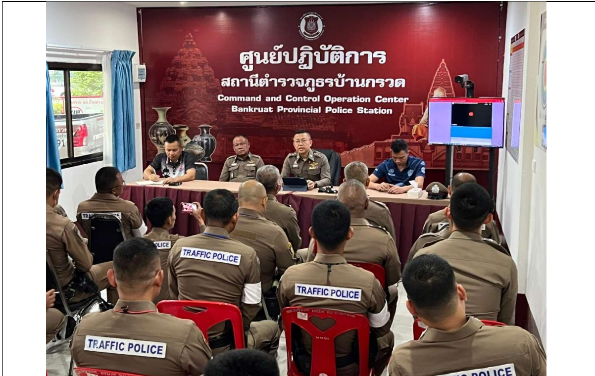
ภาพการประชุมประจำเดือนมกราคม๒๕๖๗